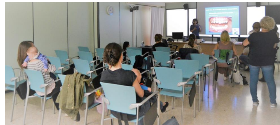
Grup de criança, des de 2022